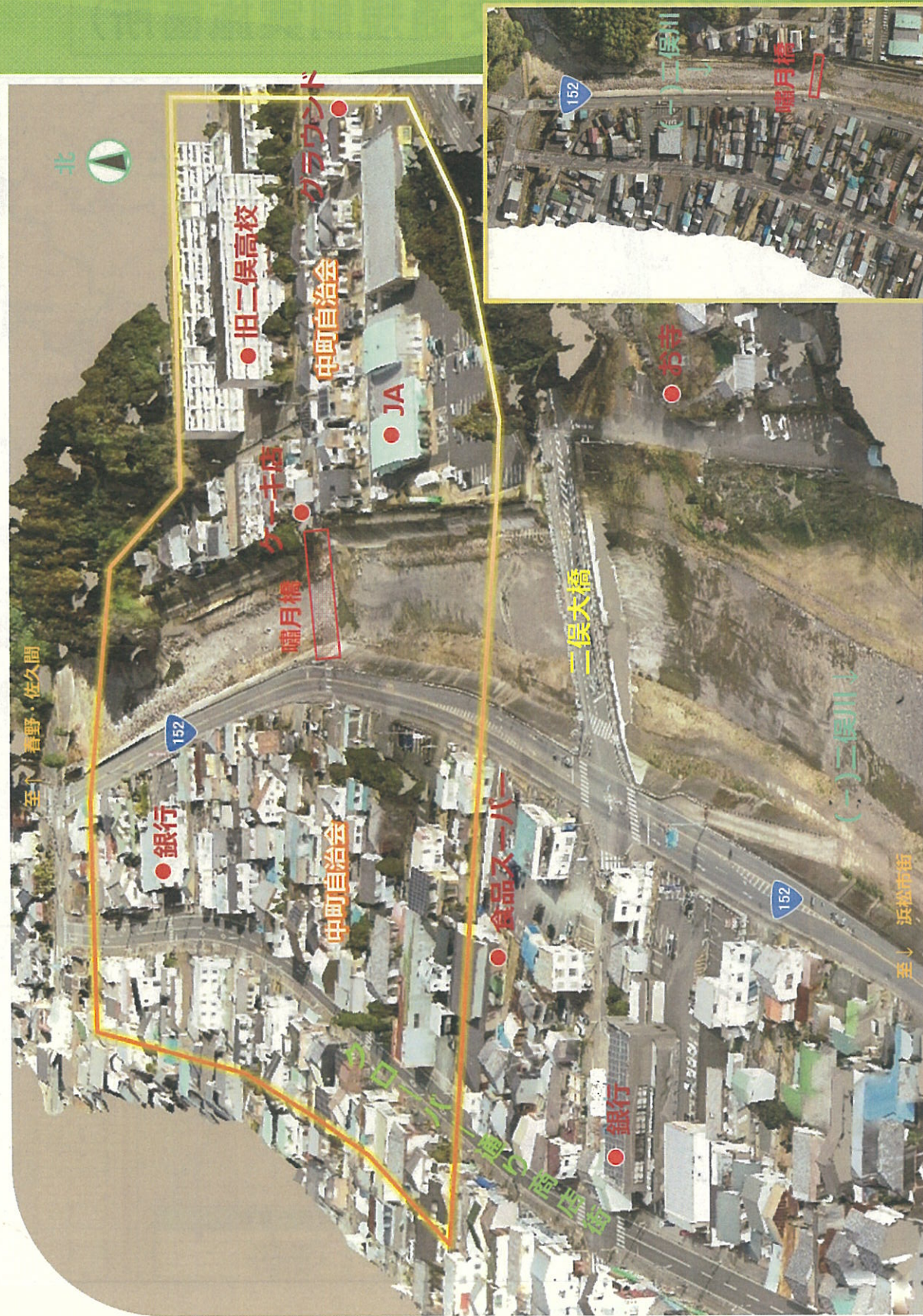
撮影日：令和5年3月4日