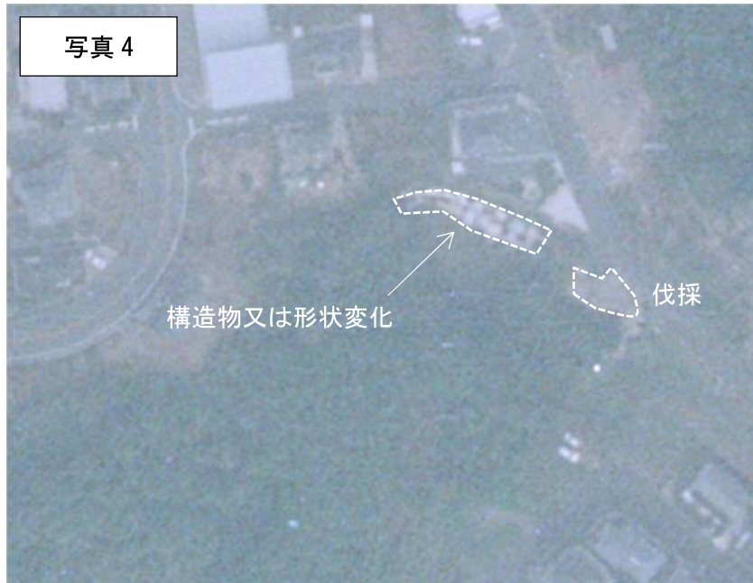
2001年（H13年）航空写真