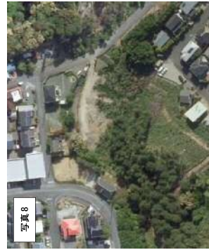
写真8 2015年 (H27年) 航空写真 斜面への土砂流出