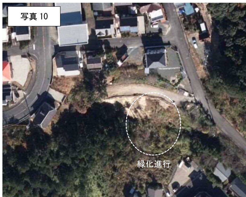
2019年（R1年）航空写真（浜松市）

2016年と比較し、2019年時点では大きな変状は見受けられないが緑化が進行した。