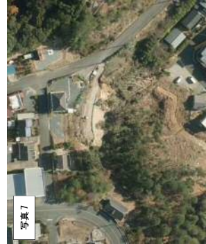
写真7 2013年 (H25年) 航空写真 (浜松市) 進入路延長、斜面の樹木減少、形状変更