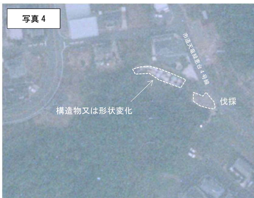
2001年（H13年）航空写真

1998年時点では、緑恵台の造成当時と同等の地形で大きな形状の変化は見受けられないが、2001年時点では市道天竜緑恵台4号線付近で樹木を伐採した様子が見受けられる。