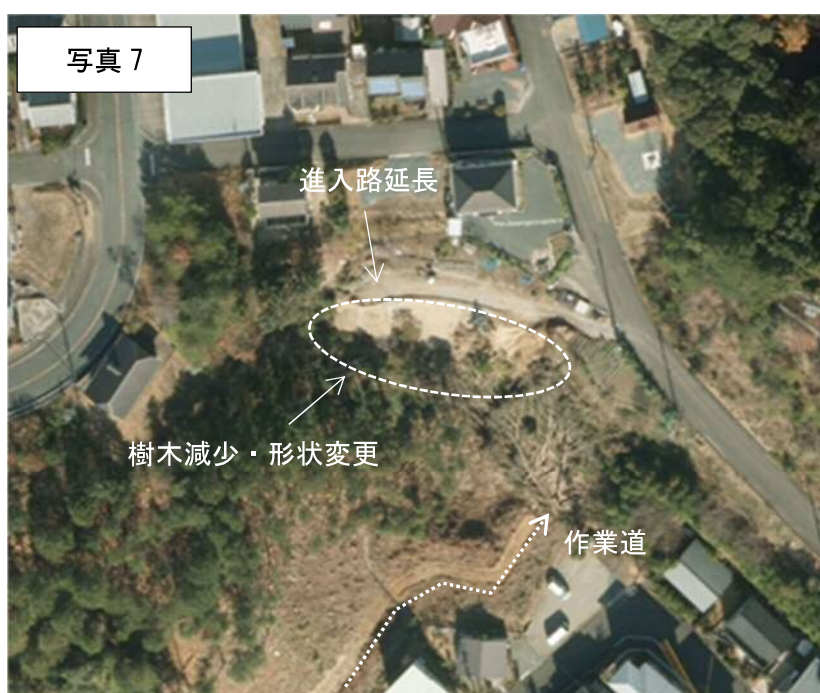
2013年（H25年）航空写真（浜松市）

2009年と比較し、2013年時点では進入路が延長され、斜面地の明らかな形状の変更が見受けられ、特に斜面西側の変化が顕著である。また、斜面地の南側に隣接土地所有者による森林法の届出に基づいた伐採に伴う作業道が形成されている。