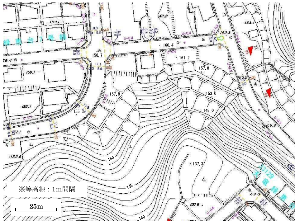
1991年（H3年9月）地形図（道路台帳）