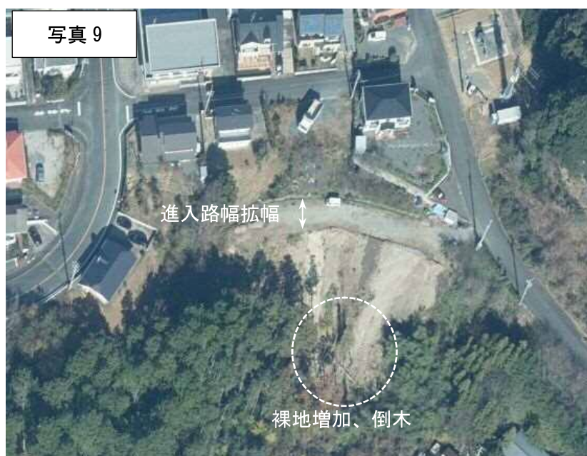
2016年（H28年）航空写真（浜松市）

2015年と比較し、2016年時点では進入路幅が拡幅されており、斜面の裸地が増加し斜面下端付近には倒木も見受けられる。また、斜面上端から下端方向に土砂が流出している様子もあり、大きな形状変更が見受けられる。