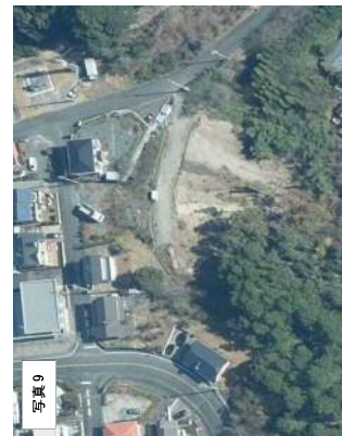
写真9 2016年 (H28年) 航空写真 (浜松市) 進入路幅広、斜面の裸地増加、倒木