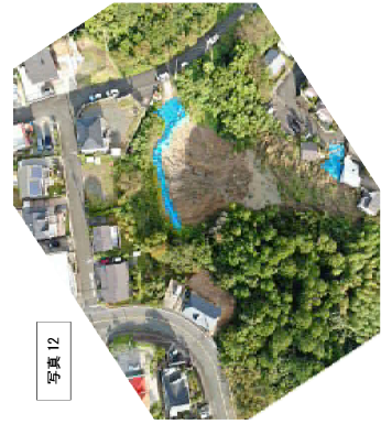
写真12 2022年 (R4年) トロロン (浜松市) 【発災】