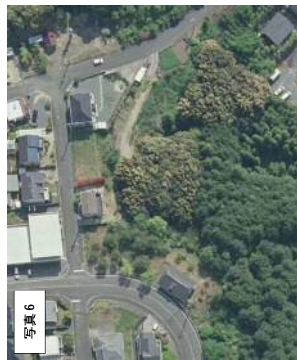
写真6 2009年 (H21年) 航空写真 (国土地理院)