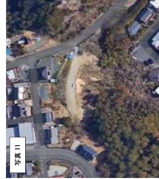
写真11 2022年 (R4年) 航空写真 (google) 撮影 ©2022 Maxar Technologies, 地図データ ©2022