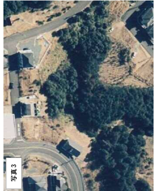
写真3 1998年 (H10年) 航空写真 (浜松市)