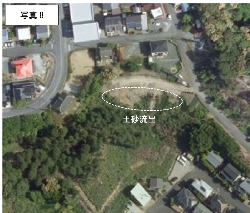
2015年（H27年）航空写真

2013年と比較し、2015年時点では土砂が斜面地に流失しているのが見受けられる。