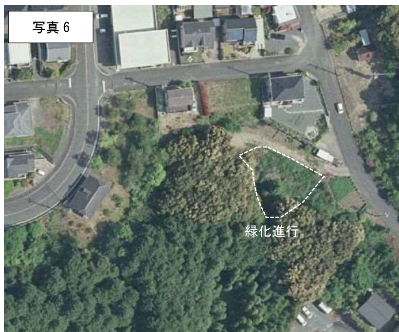
2009年（H21年）航空写真