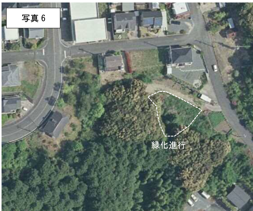
2009年（H21年）航空写真