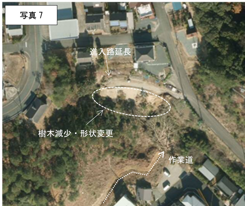
2013年（H25年）航空写真（浜松市）