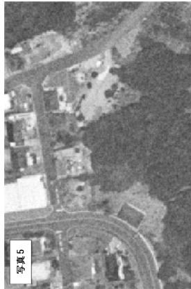
写真5 2004年 (H16年) 航空写真 進入路形成、斜面に裸地