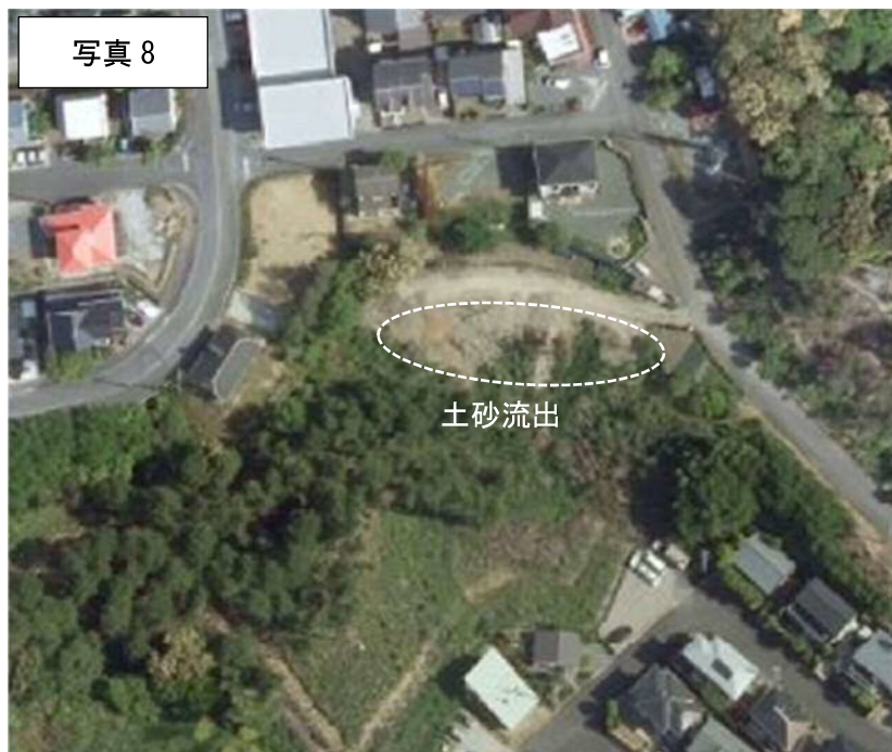
2015年（H27年）航空写真