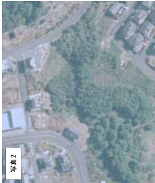
写真2 1997年 (H9年) 航空写真