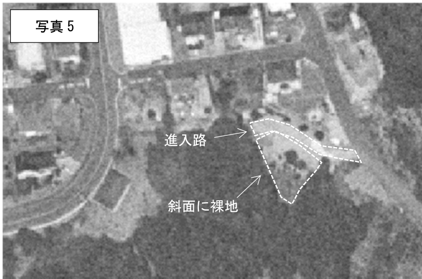
2004年（H16年）航空写真