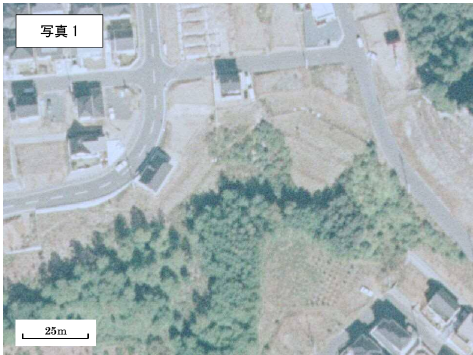
1990年（H2年）航空写真