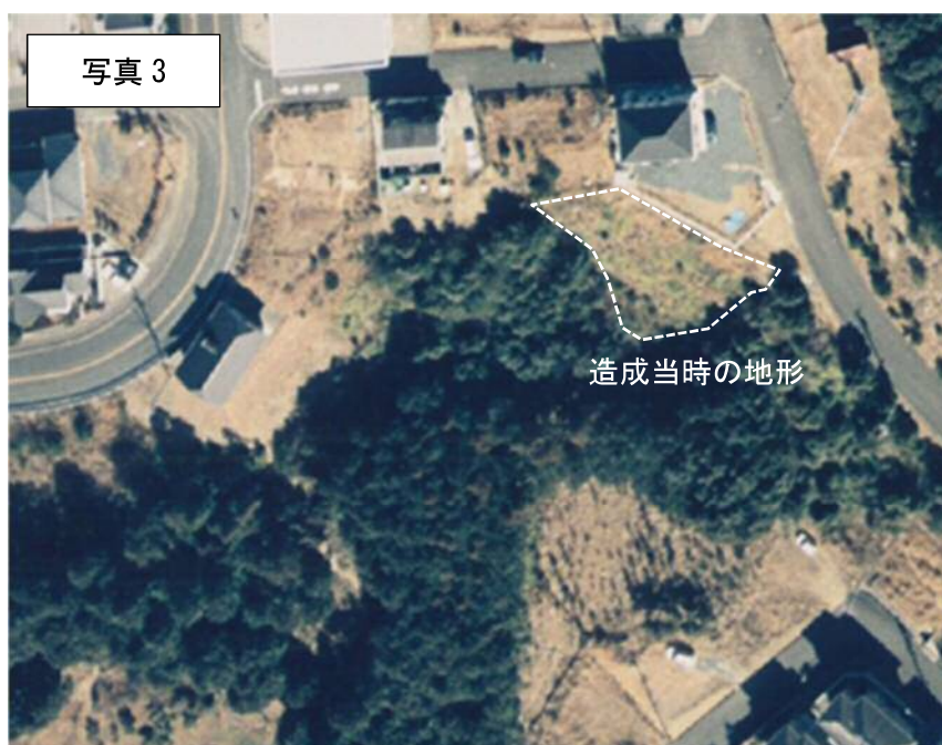
1998年（H10年）航空写真（浜松市）