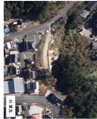
写真10 2019年 (R1年) 航空写真 (浜松市)