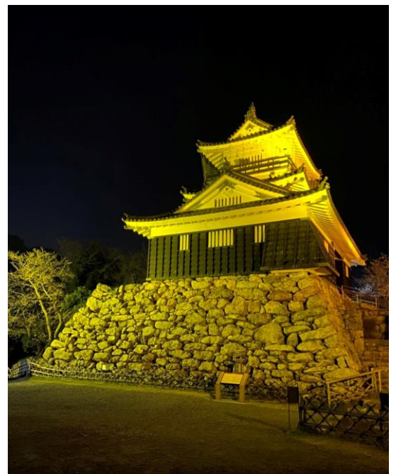
【令和3年度のライトアップの様子】