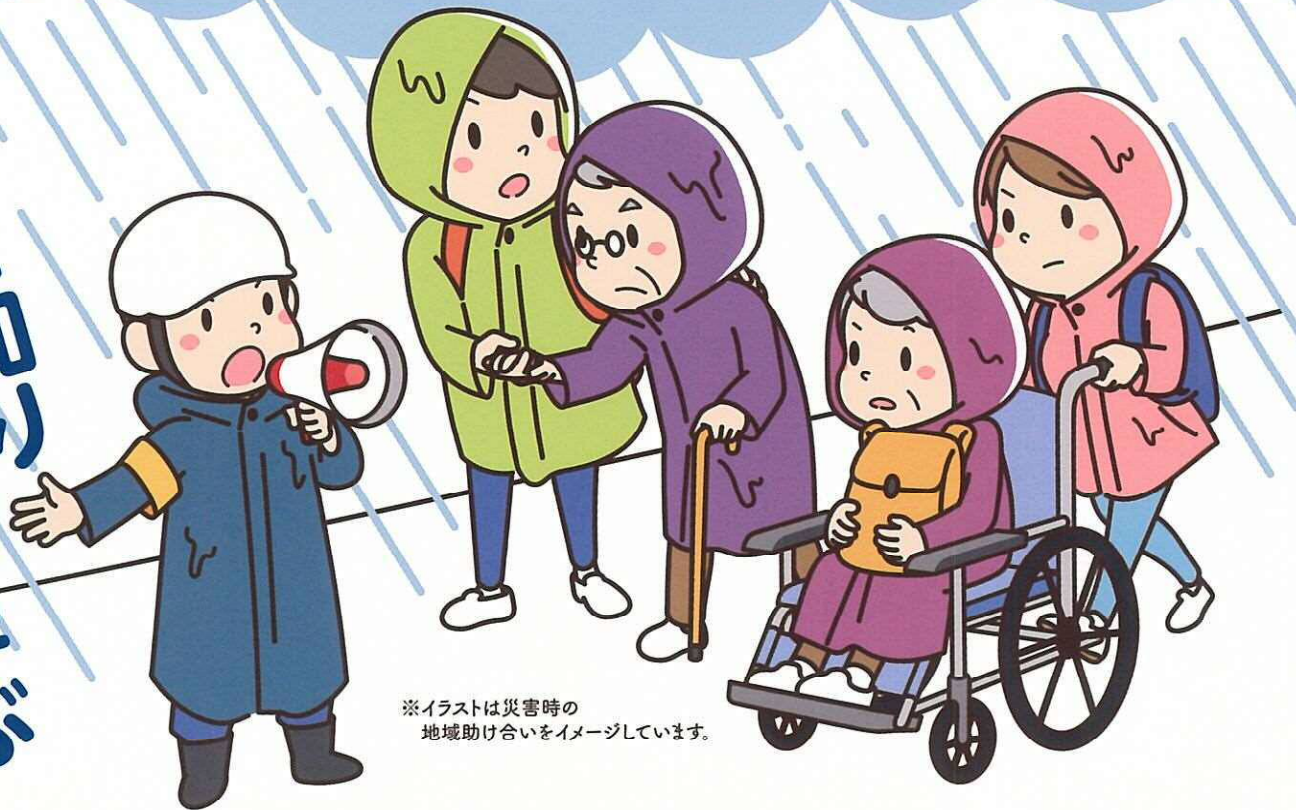
※イラストは災害時の 地域助け合いをイメージしています。