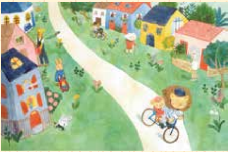
ホアン・アーウェン (台湾) 「起きてよ、ババ!」