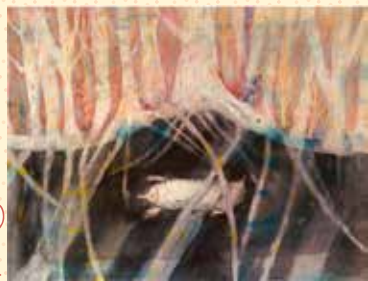
相澤 史 (日本) 「わたし、お姉ちゃんになります」

世界各国から応募された入選作品を通じて、イラストレーションによる多様な表現をご覧いただくとともに、新しい絵本の魅力や世界観をお楽しみください。