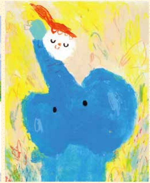
チャン・シャオチー (台湾) 「ずっと目を つぶっていられたら いいのにな」