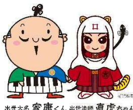
出生大名 家康くん 出せ法師 直虎ちゃん

●「広報はままつ」が必要な方は、お近くの協働センターまたは東行政センター地域振興（☎053-424-0115）にお問い合わせください。