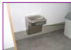
冷水器 (1 階)

車いす使用者も無理なく利用できる高さで造られ、足元が入るスペースが広く作られています。