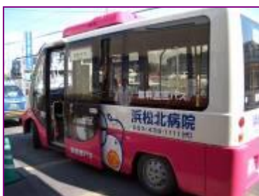
(送迎バス「きたそう」)

病院への無料送迎バスを、1日4便、3方面に走らせています。出入口が低いので、乗り降りしやすくなっています。