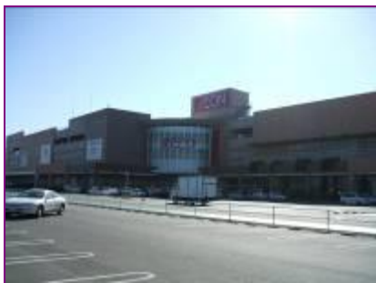
(イオンモール浜松市野店)

毎日多くの人を訪れるショッピングセンターは、どんな人でも買い物しやすいように、さまざまところにユニバーサルデザインが取り入れられています。