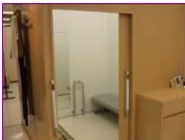
(ショッピングセンター 衣料品売場)

普通の試着室より、広く作られていて、段差もないため、車いすやベビーカーと一緒に入ることができます。腰を下ろせるソファがあるので、試着もゆったりできます。ソファの横には、手すりも付いているので、立ち上がる時に便利です。