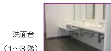
洗面台 (1～3 階)

車いす使用者も無理なく利用できる高さで造られ、足元が入るスペースが広く作られています。