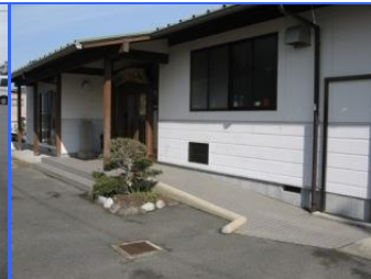
かわわちちようしもこうみんかん (河輪町下公民館/河輪町)