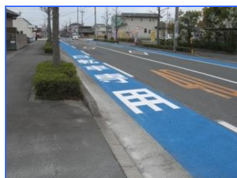
せいでんじちよう (西伝寺町)

ほこうしゃ じてんしゃ じどう 歩行者と自転車、自動 車が通る道を分けるこ とで、みんなが安全で 快適に通行できる工夫 をしています。