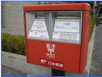
みなみやくしよ えのしまちよう (南区役所ほか／江之島町ほか)

ゆうびん せつめいが 郵便ポストの説明書 いがい えい きは日本語以外に英 ご てんじ か 語と点字が書かれて います。また、昔な むかし がらの赤い色もわか りやすいです。