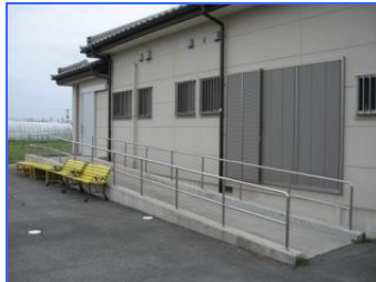
おんぢちようこうかいどう (恩地町公会堂/恩地町)

くるまいすようちゆうしゃじょう 車椅子用駐車場や、そこから入口までのスロープを設置するなどの工夫がされています。 また入口付近にあるベンチは、気軽に休めて、とっても便利です。