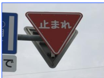
せいでんじちよう (西伝寺町)

よる 夜でも気がつきやす いように、標識に ついていいるランプが 点滅します。見落と す心配が少なくなり ます。