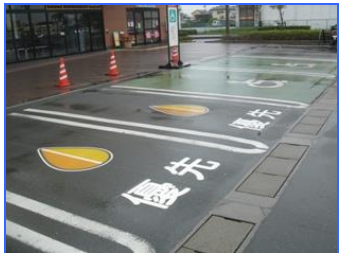
えんてつ (遠鉄ストア立野店/立野町)

いりぐちふきん 入口付近に車椅子用駐車場や優先駐車場があれば出入りが楽です。 多機能トイレが用意されていると、車椅子の人や子ども連れの人でも安心です。