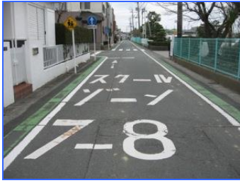
よしかわきたしょうがっこうまえ ずだじちょう (芳川北小学校前／頭陀寺町)

じどう とお 児童が多く通る学校 前の道路は時間を区 ぎ ぼこうしゃせんようどう 切って歩行者専用道 ろ路にしているから安 しん 心です。