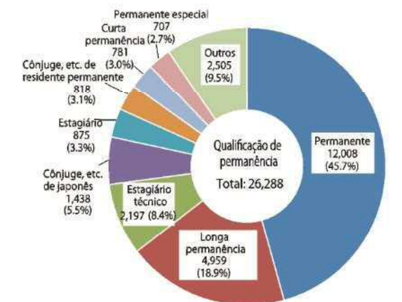
«Qualificação de Permanência» (Dados de final de agosto/2022)