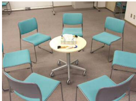
写真のように椅子を丸く並べて語り合いを行っています。

新型コロナウイルス感染対策として、体調管理 チェック シートの記入、検温、マスク着用のご協力をいただいています