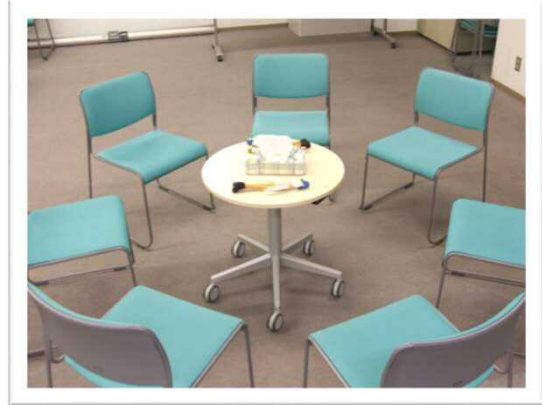
椅子を丸く並べて語り合いを行っています。