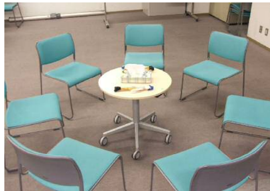
写真のように椅子を丸く並べて語り合いを行っています。