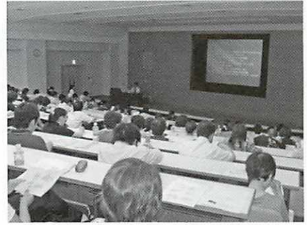
6月23日テーマ「総合失調症」 なゆた浜北 大会議室にて

こころの病気は、当事者にしか理解できない症状があり、それが生活していく上での障がいとなることがあります。精神障がいのある人が社会で生活するためには、周囲がその病気や障がいについて正しく理解することが大切です。精神保健福祉センターでは、市内の福祉施設、医療機関、市職員などを対象に精神障がい理解のための研修会を全8回開催します。