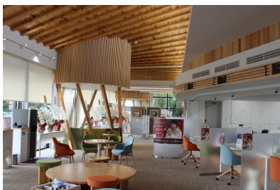
FSC 認証材を使用した店舗 (浜松信用金庫於呂支店)