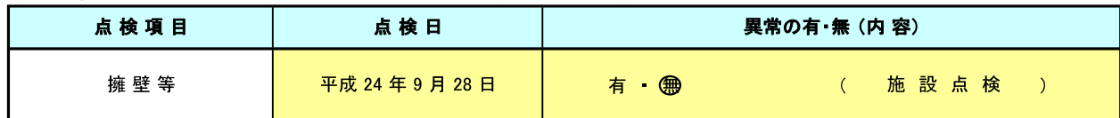
(月1回点検) 表3. 点検結果