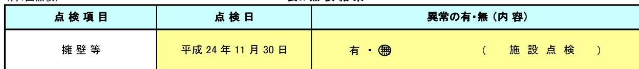
(月1回点検) 表3. 点検結果