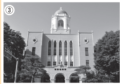
③ 静岡市役所本館 スペイン風のデザインで青いドームが特徴的。国の登録有形文化財

静岡市を象徴する歴史的建築物が浜松市出身の建築家によって設計されたことはあまり知られていません。第二次世界大戦中、米軍による空襲の標的となった浜松市は、浜松大空襲(昭和20年)で壊滅的な被害を受けました。浜松市街地の焼け野原の写真①には数少ない建物が残ります。そのひとつが「旧遠州銀行本店(現:静岡銀行浜松営業部)②」です。