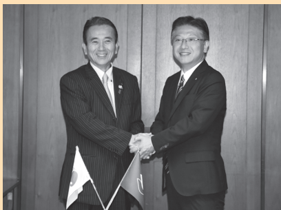
平成28年第14回浜松市・静岡市首脳会合(G2) 鈴木康友浜松市長(左) 田辺信宏静岡市長(右)

「静岡市のほうがおしゃれた」「浜松市には世界的企業がいくつもある」などの話題を時々耳にし、両市がライバル関係にあるような風潮を感じますが、実はとても仲がいいという事例を紹介しましょう。両市長が年に1度、首脳会合(G2)を開いています。静岡県の政令指定都市として共通する課題について意見交換し、解決に向けた連携・協力を進め、地域経済の活性化やよりよい県土づくりを目指すため、平成20年度からスタート。昨年は14回目の会議が開催されました。同様に、浜松市と静岡市の区長会議も定期的に行っています。この区長会議は平成23年に浜松市中区と静岡市葵区の2区で始まり、平成27年度からは全ての区長が参加し、お互いの施策について意見交換しながら、交流を深めています。