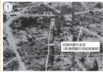
① 旧遠州銀行本店 (現:静岡銀行浜松営業部) 米軍の爆撃後の浜松市中心地、多くの市民が犠牲となった