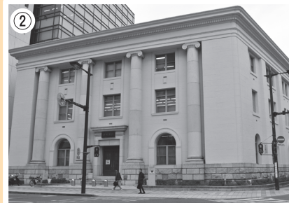
② 旧遠州銀行本店 (現:静岡銀行浜松営業部) 浜松市指定文化財