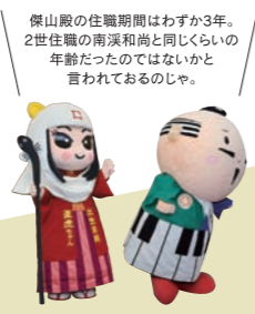
傑山の住職期間はわずか3年。2世住職の南溪和尚と同じくらいの年齢だったのではないかと言われているのじゃ。

彦根にある龍潭寺 昊天が彦根(佐和山)に開山したとされる弘徳山龍潭寺。 DATA 滋賀県彦根市古沢町1104 ☎0749-22-2777 時/9:00~17:00 (11月中旬から2月末は、16:00まで)