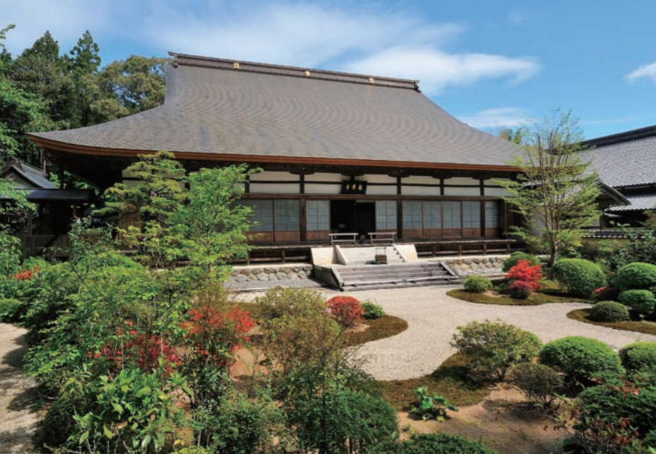
本堂を中心に、西側の稲荷堂・開山堂、北側の井伊家御霊屋など、江戸時代に建てられた由緒ある建物内には貴重な文化財を多数所蔵しており、井伊家拝領の品々も見ることができる。