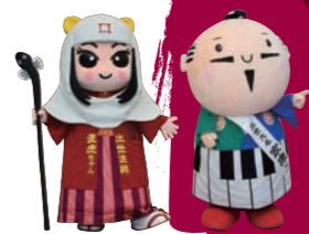
家康くんが分析! 昊天メーター