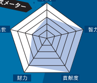
家康くんが分領政次メーサー