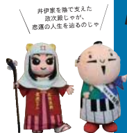
井伊家を建てた政次殿じゃが、感謝の人生を送るのじゃ