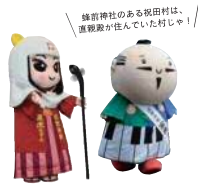
蜂前神社のある祝田村は、直虎殿が住んでいた村じゃ！

DATA 浜松市北区細江町中川6915 交 / JR浜松駅「奥山」「伊平」「金指 気賀」行きバス「祝田南」バス停下車徒歩約5分