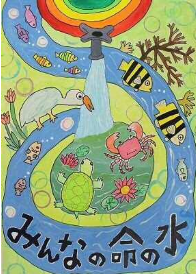
題名「みんなの命の水」

どんな動植物にとっても命の水。 動物たちの生き生きとした表情が現れています。 清らかな水が命を支え、命を育んでいる様子がよく表現されています。 バックにある水の輪も効果的に表現を支えています。 色合いも明るく、イメージの良い優れた作品に仕上がっています。