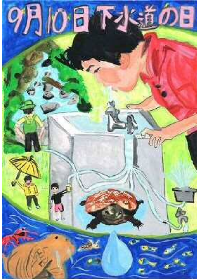
題名「水の使われ方」