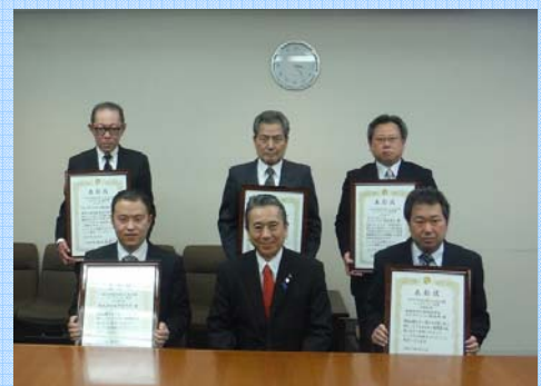
トップランナー大賞表彰式