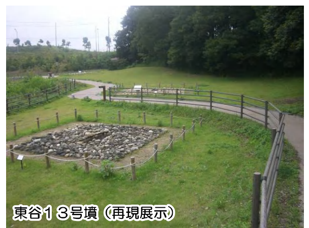
東谷13号墳（再現展示）

「積石塚」とは、石で墳丘が築かれた古墳のことです。日本国内の古墳は、通常、土で墳丘を築くので、積石塚は非常に珍しい存在で、静岡県内で唯一の積石塚群です。