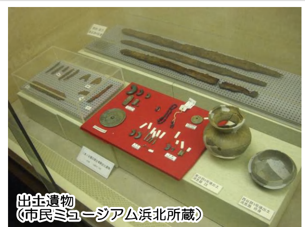
出土遺物 （市民ミュージアム浜北所蔵）