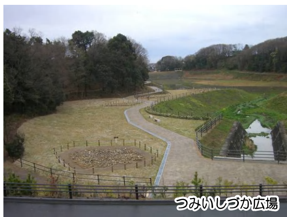
つみいしづか広場

平成17年度より実施してきた二本ヶ谷積石塚群の保存整備工事がほぼ完了し、8月2日（土）午後3時より「つみいしづか広場」として、一般公開を始めます。現地では、緑が豊かな池の周囲を散策しながら、6基の再現された積石塚を見学することができます。また、駐車場や公衆トイレなども備えていますので、ぜひ一度お立ち寄りください。