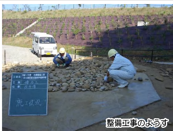
整備工事のようす