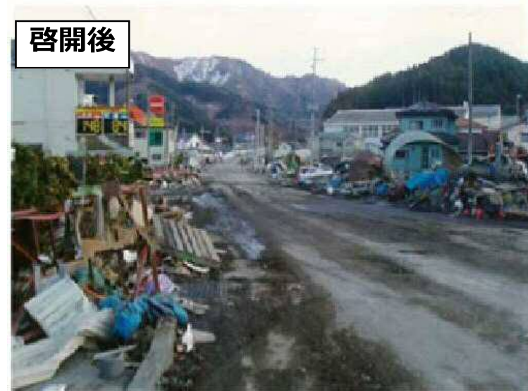
道路啓開の様子（東日本大震災）