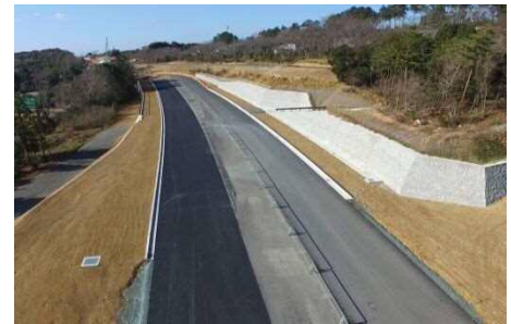
〈国道 362 号(宮口バイパス)〉