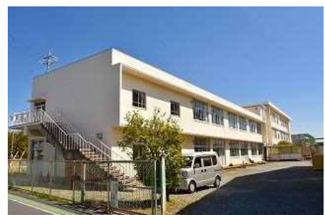
〈北浜中学校北校舎〉

生徒の安全を確保するとともに、子どもたちに良好な学習環境を提供するため、老朽化した北浜中学校北校舎の大規模改造工事を行います。(平成 30~31 年度工事)