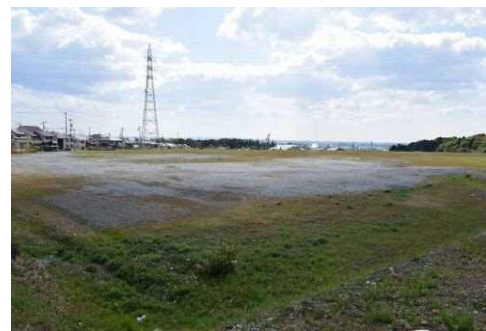
〈染地台多目的広場予定地〉