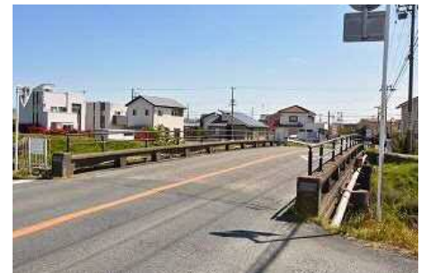
〈県道 細江浜北線(雷神橋)〉