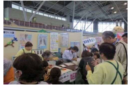
<肺年齢測定・ソルセイブ>