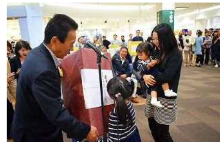
<地域力向上事業で助成した

団体からの提案に基づき、市が公益上の必要を認め、団体が主体的に取り組む事業に対し助成します。