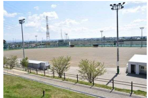
〈平口サッカー場スポーツ広場〉