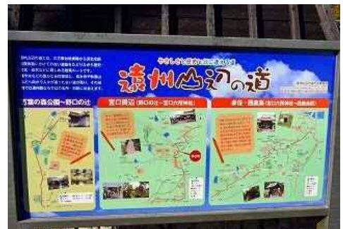
〈遠州山辺の道サイン看板(庚申寺)〉