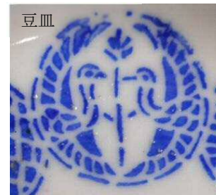
向かい鶴丸 羽を広げた二羽の鶴が向かい合う文様。

宝づくし文は、中国では仏教で吉祥とされる八種類の法具や荘厳具を組み合わせた「八宝」をはじめ、「七宝」、「雑宝」があります。日本では、これを日本風に置き換えました。右図では、上から打ち出の小槌・分銅・宝巻・丁子・七宝・宝珠が描かれています。他にも隠れ蓑や隠れ笠、熨斗などがあり、さらに「松竹梅」や「鶴亀」が加わることがあります。