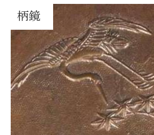
飛鶴 鶴が飛翔している姿を文様化したもの。