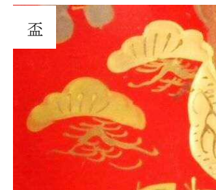
笠松 松葉が笠のようになっていて、枝を笠の紐のように見立てた文様。