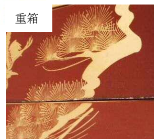
老松 年月を経た松を文様にしたもの。枝ぶりが見事なものが多い。