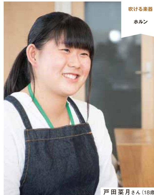
吹ける楽器 ホルン

入塾して半年近くが過ぎ、研修生たちもすっかり打ち解けて、時には講師と冗談を交わしながら、和やかなムードで実習が進む。 直してくれた喜びや直す喜びに導かれて 研修生たちに入塾の動機を聞くと、「友だちの楽器を直してあげたらすごく喜んでくれたから」「自分の大切な楽器を先輩が直してくれたことに感激して」など、楽器修理にまつわるエピソードがきっかけが多い。 直して喜ばれたり、直してもらって喜んだり。どちらも結果的にリペアマンになりたいという夢につながった。