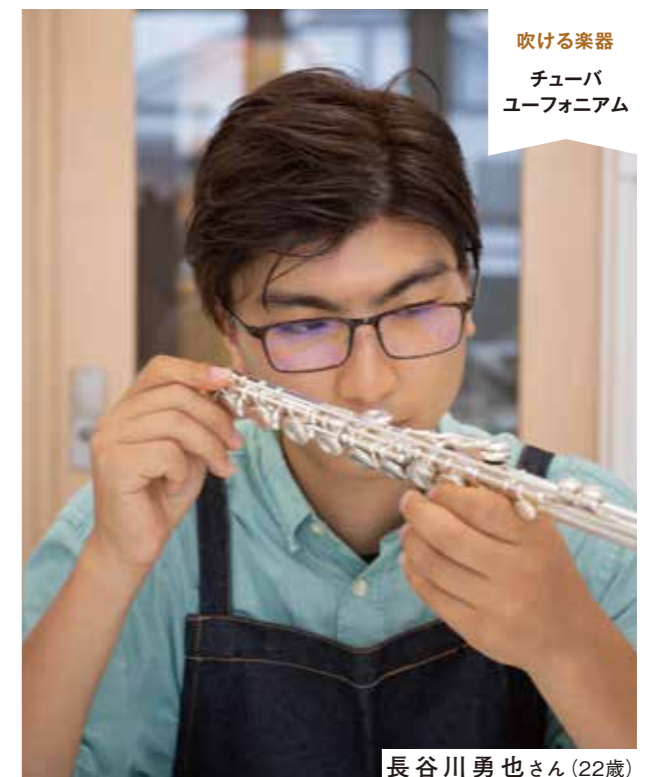
吹ける楽器 チューバ ユーフォニアム