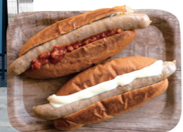
フレンチシェフが監修した大きな生ソーセージのホットドックは全5種類。