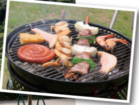
お肉と野菜がセットになった特製BBQにお替わり自由のこはんとソフトドリンク付き