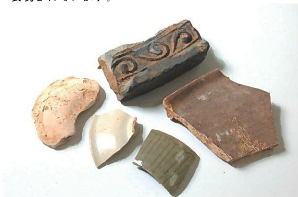
御誕生場で発見された井戸（右）と井戸から出土した瓦・陶磁器（左下）

井戸は直径 1.6mほどの素掘りの井戸です。井戸の中から出土した陶磁器が生産された時期は 1560 年代から 1570 年代です。徳川家康が浜松城を居城とした時期や秀忠が生れた時期（1579 年）と重なります。