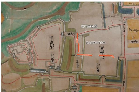
絵図と二の丸の調査地（上）