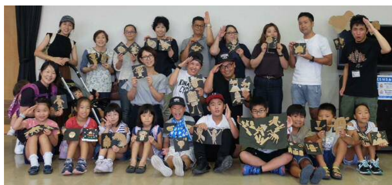
木梨憲武展ワークショップ「オリジナル・フェアリーズを作ろう」