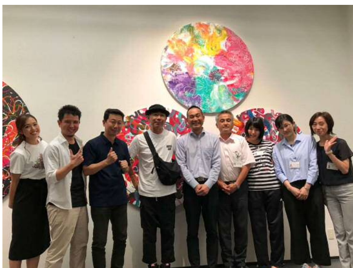
浜松市美術館に来館した木梨憲武氏