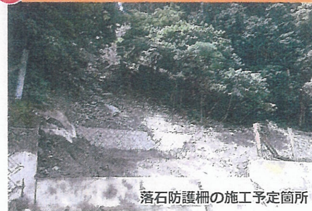
落石防護柵の施工予定箇所