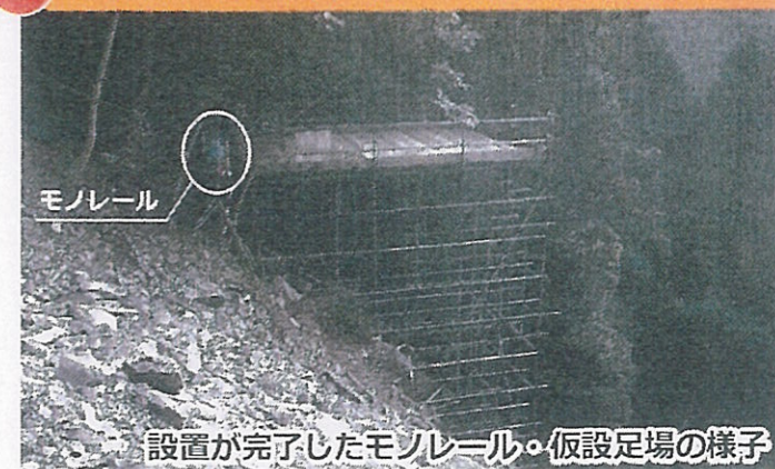
設置が完了したモノレール・仮設足場の様子